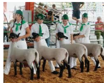
Participating in the Shasta County 4-H program exhibit their project lambs at the Shasta District Fair.

Las ferias ofrecen oportunidades para que los miembros exhiban sus proyectos del año pasado y se den cuenta de cómo han desarrollado sus habilidades. Las ferias también son el lugar donde los miembros de 4-H comparten con la comunidad las actividades de su club. Cada feria se rige por un conjunto de normas que deben ser revisadas cuidadosamente por el personal de UC 4-H. La mayoría de las ferias no son dirigidas por UC 4-H. Registrar los proyectos de UC 4-H en ferias del condado, distrito, y estado es responsabilidad de los miembros de UC 4-H. Los miembros 4-H deben contactar a su líderes de proyecto para obtener los formatos necesarios, para que los ayuden a completar formularios, y a incluir las firmas que se requieren. Los miembros son responsables por entregar sus formatos a tiempo. Es la responsabilidad de los miembros saber las normas y seguirlas, mientras representen a UC 4-H, siguiendo el código de conducta de UC 4-H.