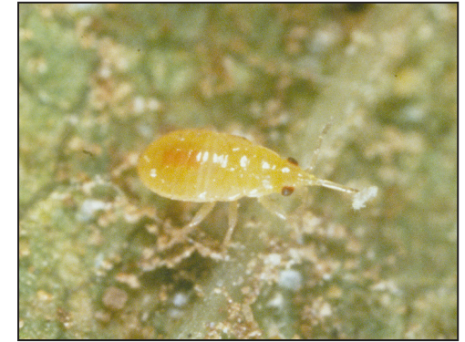
Depredador: Ninfa de la chinche pirata diminuta