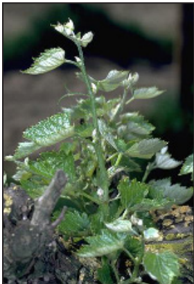
Daño temprano en los brotes