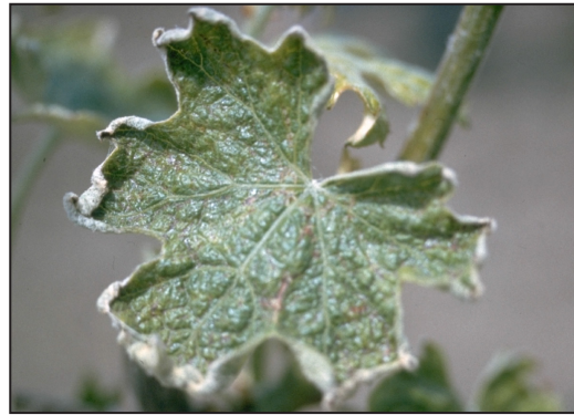
Daño: que se observa en la mitad de la temporada