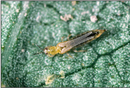
Trips occidental de las flores, Frankliniella occidentalis