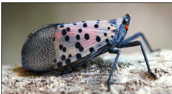
Fotografía 1. Vista lateral del adulto de la mosca linterna con manchas (MLM).

Las plagas exóticas tienen el potencial de causar daños económicos severos. Al ser introducidas en un nuevo entorno no hay depredadores que las controlan. En condiciones normales, en su medioambiente de origen, estas plagas están controladas por sus enemigos naturales. El comercio y los viajes internacionales y nacionales son los medios ideales para la introducción de plagas exóticas a los Estados Unidos y California. Por lo tanto, la identificación y detección temprana de plagas exóticas es un aspecto clave para evitar que se establezcan en California. Todos, incluyendo a los agricultores, asesores, trabajadores del campo y jardineros del hogar pueden desempeñar un papel importante en mantener a las plagas fuera de su condado, convirtiéndose en los ojos y oídos necesarios para la detección temprana de la próxima plaga exótica.