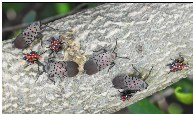
Fotografía 6. Ninfas de cuarto estado y adultos de la MLM.

La mosca linterna con manchas tiene la capacidad de impactar negativamente los cultivos de alto valor en California si se llegara establecerse. En un esfuerzo por