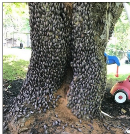
Fotografía 2. Aglomeración de MLM adultas en áreas urbanas.

La mosca linterna con manchas (MLM) o Lycorma delicatula , es una nueva plaga exótica que fue detectada por primera vez en Pensilvania en el 2014 (Fotografía 1). Luego se le encontró en Nueva York y Delaware en el 2017 y en Nueva Jersey, Maryland y Virginia en el 2018. La MLM mide aproximadamente 1 pulgada de largo y media pulgada de ancho y proviene del norte de China, pero también se le encuentra en Vietnam, Japón y Corea del Sur. Este insecto saltador se alimenta de más de 70 especies de plantas de las cuales, por lo menos 40, son conocidas en Norteamérica. La MLM ha causado daños económicos en los viñedos y se alimenta de árboles frutales (manzanos, cerezos, frutas de hueso) y plantas ornamentales leñosas. Su hospedero preferido es el árbol invasivo del cielo ( Ailanthus altissima ). Las MLM perforan y succionan la savia de la planta y excretan grandes cantidades de fluidos (mielcilla). Sobre la mielcilla crece un moho negro llamado fumagina (moho). Además de ser una plaga agrícola, la MLM puede ser una molestia en áreas urbanas debido a su comportamiento de establecerse en grupos numerosos. (Fotografía 2).