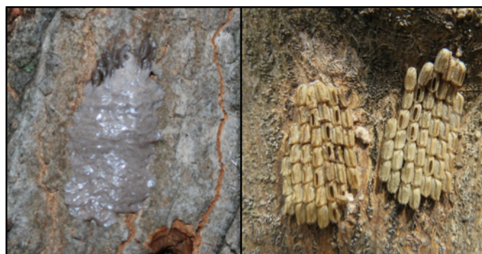
Fotografía 3. Huevecillos de la MLM cubiertos con una capa cerosa (izquierda). Huevecillos parecidos a semillas con perforaciones indicando que las ninfas han salido (derecha).

En Pensilvania, la mosca linterna con manchas produce una generación cada año. Las ninfas emergen entre abril y junio y pasan por cuatro etapas juveniles. Los adultos emergen a finales de julio. La MLM sobrevive el invierno como huevecillos que son depositados entre agosto y noviembre en superficies lisas de árboles y objetos como postes de teléfonos, piedras, paletas, equipo para exterior, leña, vagones de tren, etc... El poner huevecillos en objetos no vegetales contribuye a su capacidad de dispersarse ampliamente y aumenta las posibilidades de que se le introduzca involuntariamente en nuevas áreas.