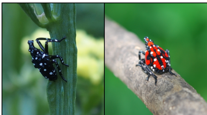
Fotografía 4. En las primeras 3 etapas juveniles son negras con puntos blancos (izquierda), en la cuarta etapa son rojas con negro y puntos blancos (derecha).

Cada hembra produce una o dos masas de 30 a 50 huevecillos. Los huevecillos, parecidos a semillas, son puestos en líneas múltiples sucesivas y cubiertos con una sustancia cerosa entre amarilla y marrón (Fotografía 3). Las ninfas en sus primeras tres etapas de desarrollo son negras con manchas blancas y no tienen alas. En la cuarta etapa son rojas y negras con puntos blancos y tienen alas pequeñas (Fotografía 4).