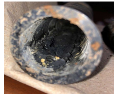
Figura 1: Tubería plástica degradada después de un incendio forestal.

Los incendios forestales pueden introducir contaminantes químicos y microbianos dañinos en las fuentes de agua potable, dañar la infraestructura hídrica y alterar las propiedades químicas del agua que llega a los hogares. Una de las principales preocupaciones es la contaminación por sustancias químicas peligrosas, en particular los compuestos orgánicos volátiles (VOC, por sus siglas en inglés), compuestos orgánicos semivolátiles (SVOCs) y sustancias cancerígenas. La contaminación por VOC ocurre con frecuencia debido a la descomposición, inducida por el calor, de los materiales plásticos en las tuberías (Figura 1), como el cloruro de polivinilo (PVC) y el polietileno de alta densidad (HDPE). Cuando se exponen a calor extremo, estas tuberías plásticas pueden degradarse y liberar VOC, como el benceno, directamente en el suministro de agua potable. 1,2 Por ejemplo, después del Camp Fire de 2018 en California, se detectaron VOC en muestras de agua de grifo de viviendas casi un año después del incendio, con concentraciones que superaban ampliamente los límites regulatorios establecidos. 3 Además, las caídas significativas en la presión de los sistemas de agua —a menudo causadas por daños en tuberías o en la infraestructura— pueden permitir que los contaminantes entren al sistema de distribución de agua a través de conexiones comprometidas. 4