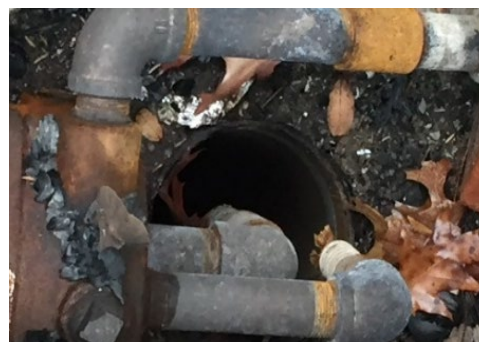
Figura 4: Bomba y tuberías de pozo carbonizadas.

Si hay daños visibles en el equipo de su pozo, tuberías internas o externas (Figura 4) o componentes eléctricos del pozo, contacte a un contratista de pozos con licencia para realizar reparaciones y pruebas adecuadas. Además, si el equipo está dañado, es esencial desinfectar y purgar su pozo.