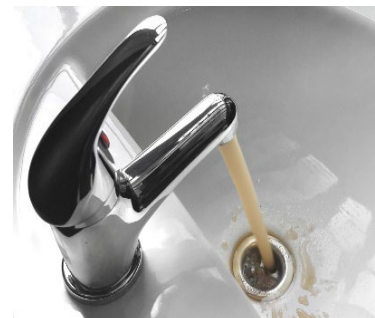
Figura 2: Agua contaminada de un grifo.

Algunos indicadores comunes de contaminación incluyen cambios en las propiedades físicas del agua potable, como un sabor, olor o apariencia inusuales. El agua turbia o espumosa, o el agua con decoloración (por ejemplo, anaranjada, marrón rojiza o azul), puede indicar la presencia de partículas en suspensión, detergentes o concentraciones elevadas de metales como hierro o cobre. 10 Además, olores distintivos como un aroma a azufre o similar a la trementina pueden sugerir contaminación por sulfuro de hidrógeno u otros compuestos químicos orgánicos. El sabor químico en el agua a menudo se asocia con los compuestos orgánicos volátiles (VOC, por sus siglas en inglés), contaminantes que comúnmente se introducen en el agua potable después de un incendio. 10 Es importante señalar que muchos contaminantes dañinos no pueden detectarse solo con los sentidos, por lo que se recomienda realizar pruebas adicionales.